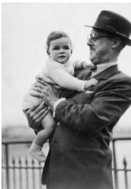
Vater (rechts) mit kleinem Kind

sie bald ihre Form verlieren oder auseinanderfallen oder höchst seltsam schmecken würden. So gesehen liegt der Gedanke nicht wirklich fern, dass die meisten unserer Umzüge von der Wahnvorstellung motiviert waren, dass sich damit Kosten einsparen ließen.