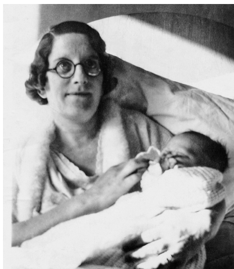
Mutter (links) und ich.