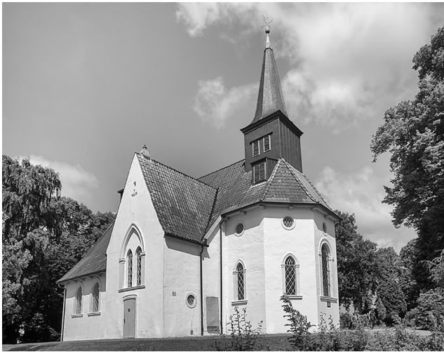
Die Matthias-Claudius-Kirche in Reinfeld heute. Hier wurde Claudius am 16. August 1740 von seinem Vater getauft, falls dies nicht im Haus geschehen ist.