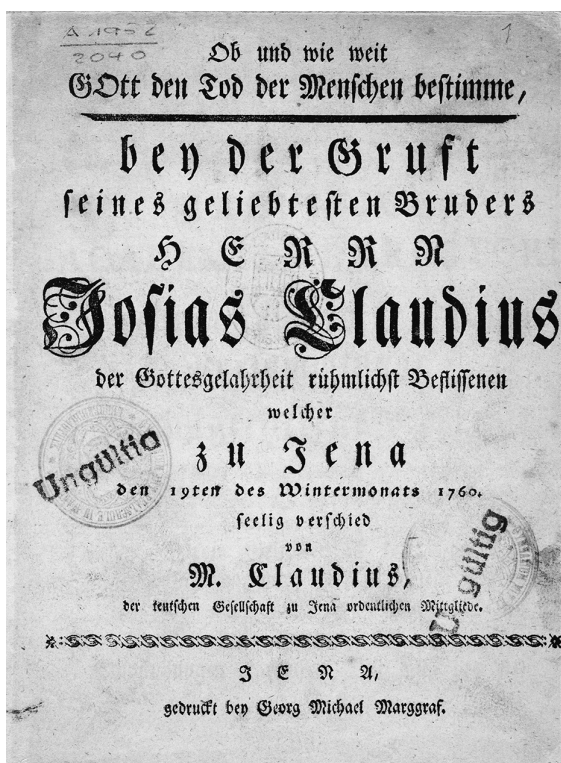
Titelblatt der von Matthias Claudius auf den Tod seines Bruders verfassten Trauerrede. Der Zwanzigjährige hielt sie »vor den Teilnehmern des akademischen Leichenzugs«. Die steife Argumentation und der barocke Stil wollen zu einem Mitglied der Teutschen Gesellschaft nur bedingt passen.

Uausgegoren und von der gelehrten Kritik nicht grundlos gescholten ist der Inhalt eines 64 Seiten umfassenden Büchleins mit dem Titel Tändeleyn und Erzählungen , das Claudius im Herbst 1762 veröffentlicht. Wer will, mag zu filtern versuchen, was von den mehr oder weniger geglückten Versen – auch die »Erzählungen« sind gereimt – als bloße Fingerübung im »stile anacreontico« einzuschätzen ist und was schon bedeutungsvoll auf den späteren Claudius hinweist. Dieser hat lediglich eines der frühen Gedichte – »An eine Quelle« – in seine Sämmtlichen Werke aufgenommen. 6 Interessanter erscheint die Frage, wie es zu einer zweiten, leicht veränderten