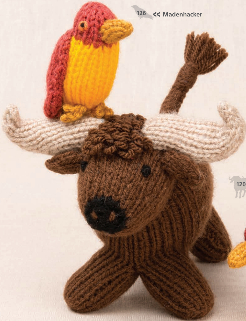
120 << Büffel