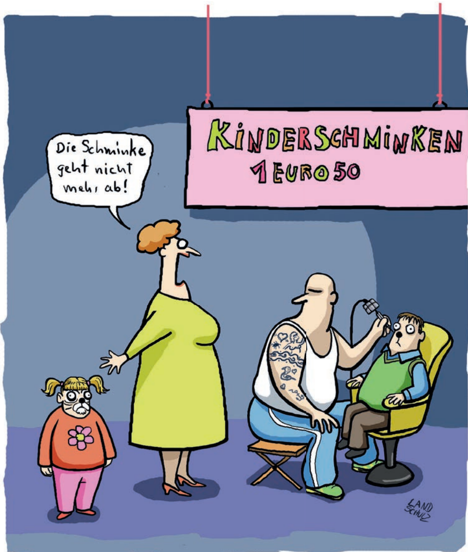
Wenn Tätowierer umschulen.