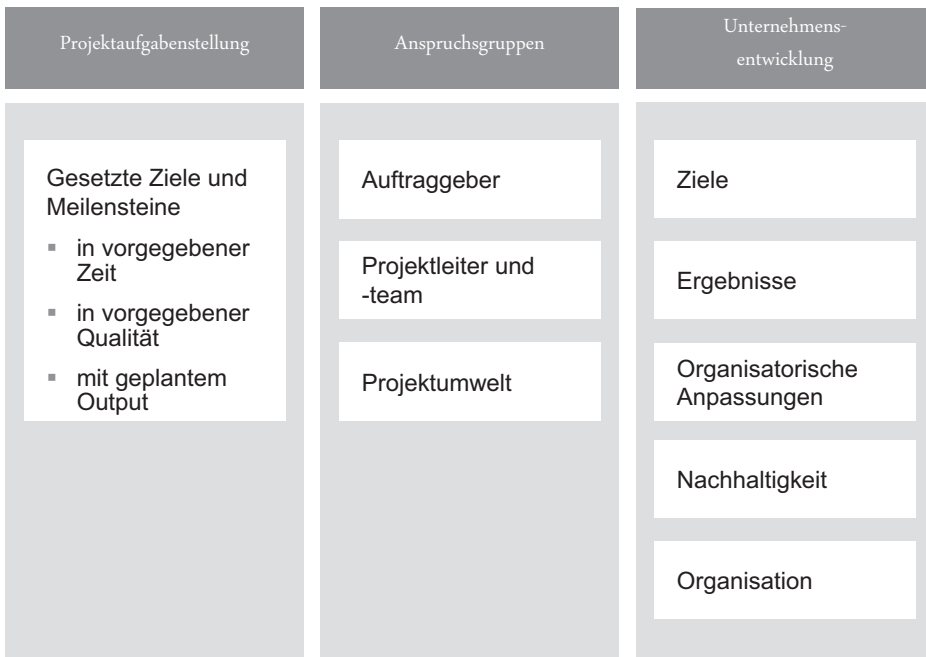
Abbildung 3: Die Erfolgskriterien in drei Dimensionen