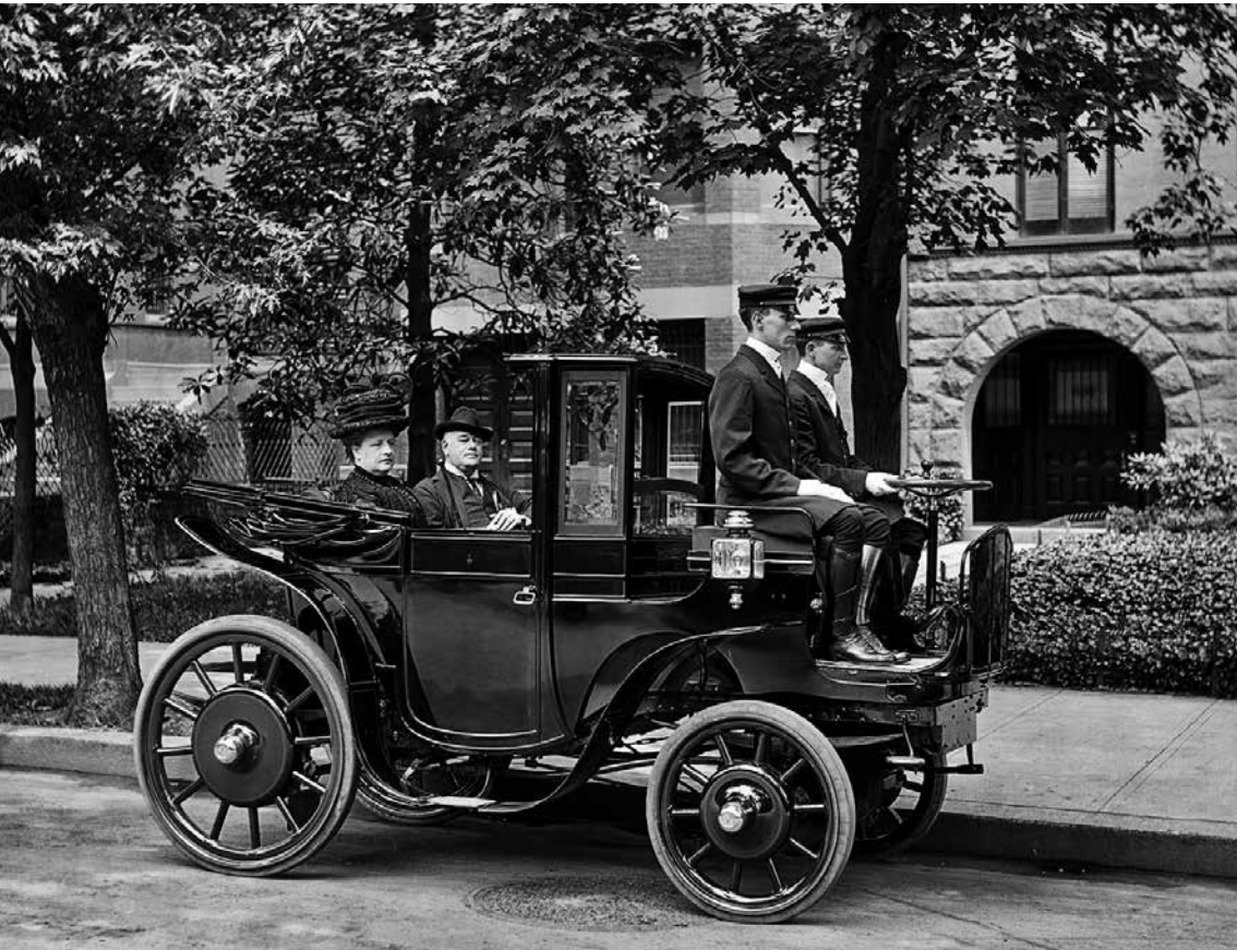
Krieger Elektroautoschke um 1905