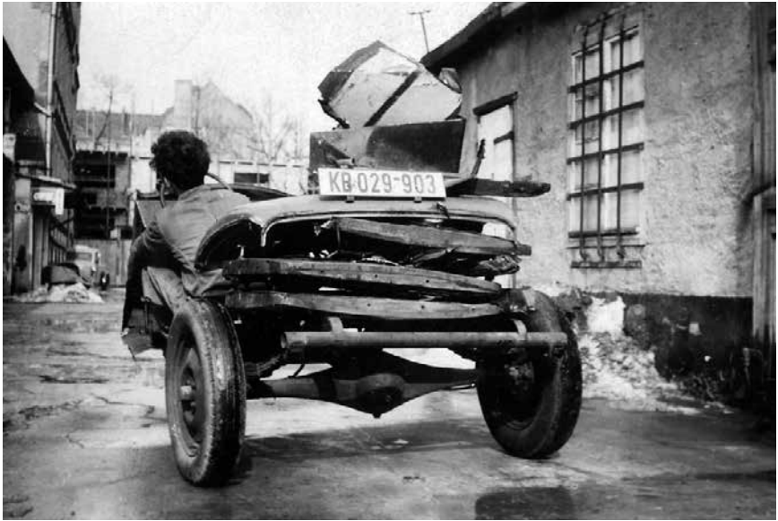
Die »Dreikantfeile« nach ihrer Zerlegung

setzen. Die kleine, zweisitzige Kabine, die Pritsche dahinter, die Fronthau- be – alles war ja im Originalzustand und hätte lediglich einer Auffrischung bedurft. Etwas mehr als Kosmetik freilich, denn das Auto wies etliche Beu- len, Schrammen und Dellen auf, eine ausgeschlagene Lenkung und defekte Bremsen. Aus heutiger Sicht jedoch wäre ein restauriertes Dreirad Modell FW 200 ungleich wertvoller als ein obskurer Eigenbau, der mehr oder weni- ger zufällig ein Borgward-Chassis besitzt.