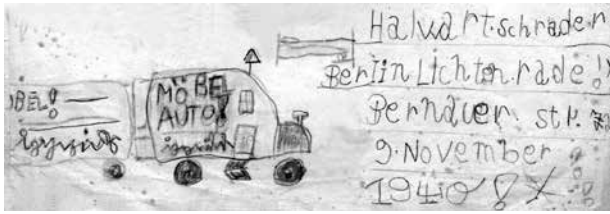
Kunstwerk eines Vierjährigen mit exakter Adressangabe

Das Auto als Gegenstand meiner Leidenschaft begann ich 1953 zu entdecken. Interessiert haben mag es mich auch schon vorher, aber nur beiläufig. Denn nicht jeden im 20. Jahrhundert aufgewachsenen Knaben hat das Automobil von klein auf fasziniert. Es gab da eine Anzahl mindestens ebenso reizvoller Phänomene: die Eisenbahn zum Beispiel, Briefmarken- und Zigarettenbildersammeln oder das damals bekanntlich hoch im Kurs stehende Militärwesen mit dem ganzen Tschinglerassabumbum.