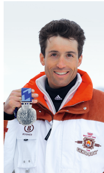
Höchster Lohn: Peter Schlickenrieder und seine olympische Silbermedaille 2002 in Salt Lake City.