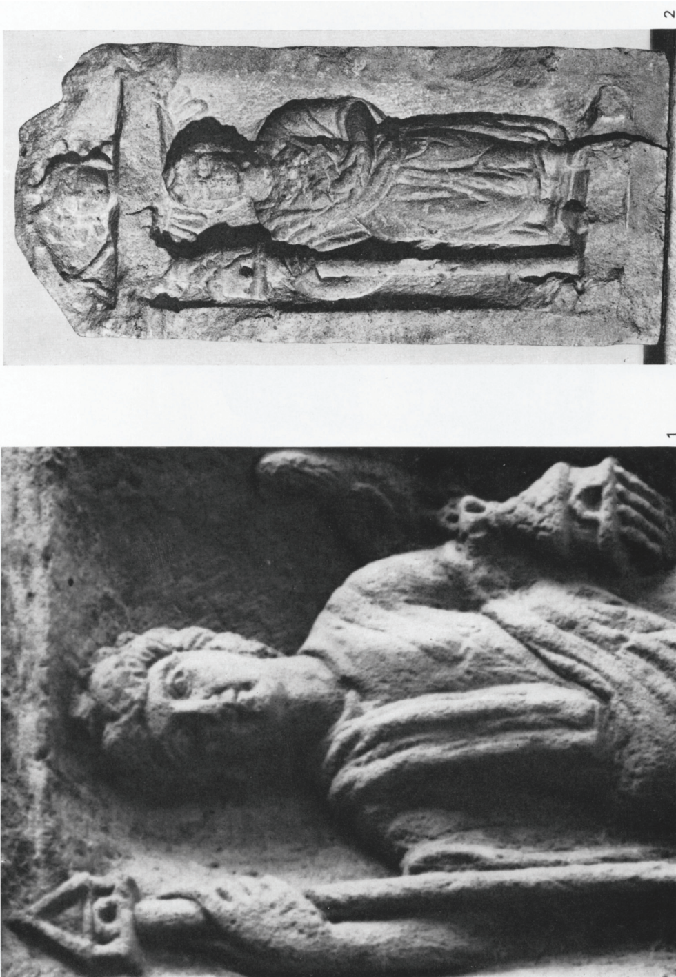
Taf. 46 1 Relief der Göttin Nantosuelta mit Stabhaus und Rundhütte aus Sarrebourg/Saarburg, Lothringen; Ausschnitt; 2 Ehemals verschollenes Relief der Göttin Nantosuelta. Dom- und Diözesanmuseum Speyer. 1 M. 4:9; 2 M. 1:5.