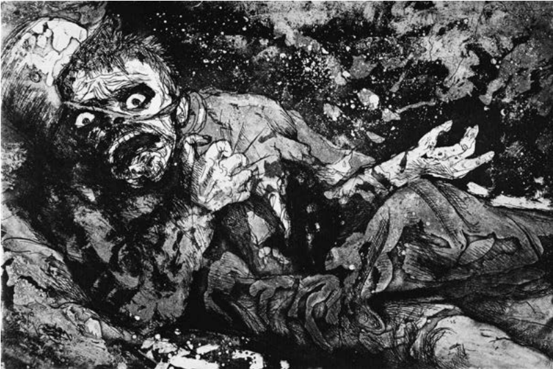
Namenloses Grauen: Verwundeter Soldat aus Otto Dix' Zyklus Der Krieg , 1924

cheldraht, Flugzeuge und Panzer – hatten den Krieg verändert und den Albtraum der Soldaten verschlimmert, und bei den führenden Köpfen in Militär und Medizin hatte ein Umdenken eingesetzt. Vor allem nach der katastrophalen, vier Monate dauernden Somme-Schlacht, bei der mehr als eine Million Männer verwundet wurden, litten viele der Überlebenden an Shell Shock. Allein 30 000 Briten zeigten die seltsamen Symptome der neuen Krankheit, die sie als Soldaten wertlos und für ihre Einheiten zu einer Bürde machte. Die Armeeführung sah sich gezwungen anzuerkennen, dass ein Soldat schwer verwundet sein konnte, obwohl ihm physisch nichts fehlte, und schon bald wurden Zehntausende von Opfern in Militärkrankenhäuser in Großbritannien geschickt.