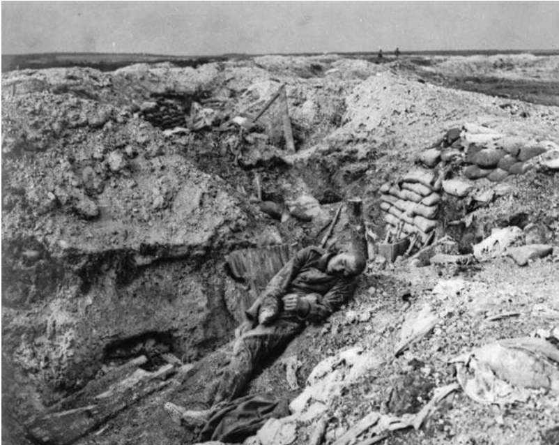
Kriegserfahrung: In der Schlacht der Maschinen gab es kein Heldentum mehr. Undatierte Aufnahme von der Westfront

falls als Patient im Craiglockhart Hospital gelandet – allerdings nicht, weil er verwundet worden war, sondern weil er seine Meinung gesagt hatte.