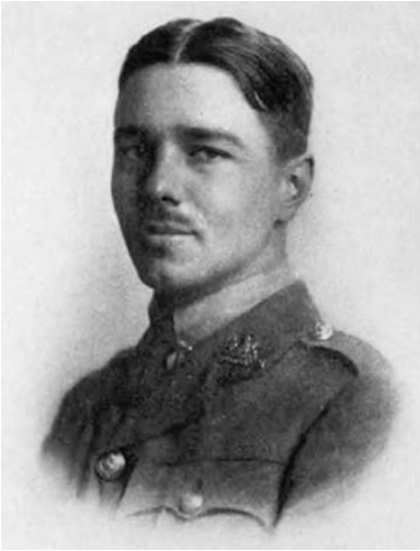
Wilfred Owen in Uniform. Die englischen War Poets schrieben über einen schmutzigen Krieg

schrieb Reginald Pound, selbst ein Freiwilliger des Jahres 1914, ein halbes Jahrhundert später. Nur die »starke, kultivierte Intelligenz« der verlorenen Generation hätte dafür sorgen können, dass »Zweitklassiges zu Erstklassigem geworden wäre, und die Degeneration der moralischen Entrüstung in unheldenhafte Toleranz« 7 aufhalten können.