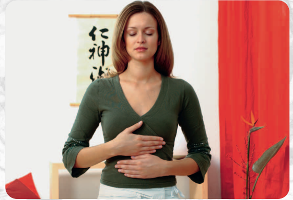
Beim Strömen sind wir ganz im Hier und Jetzt