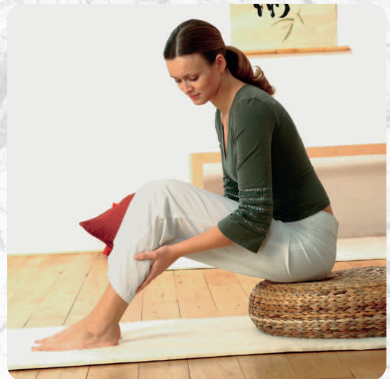
Wohltuende Berührung der Hände – das tägliche Strömen