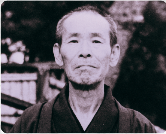
Jiro Murai – er entdeckte Jin Shin Jyutsu